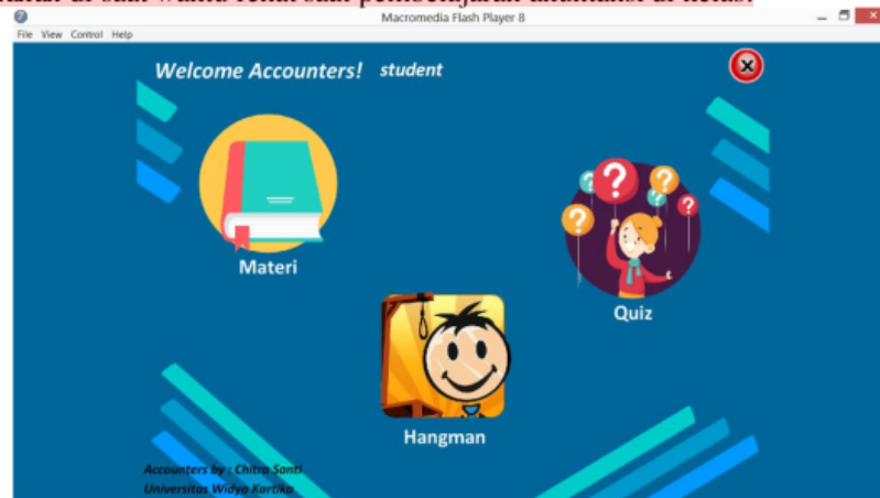
Gambar 1. Tampilan muka software Accounters .

Dari hasil kuisioner menjelaskan bahwa sebesar 76% siswa belum memahami akuntansi yang telah diajarkan di Sekolah. Ketidakhahaman mengenai akuntansi dikarenakan kurangnya praktek yang dibutuhkan oleh para siswa. Namun sebanyak 68% siswa mengatakan bahwa software akuntansi Accounters ini, tampilan muka pada software tersebut mudah digunakan oleh para siswa setiap saat. Selain itu, terdapat menu permainan ( hangman ) yang dapat digunakan di saat waktu rehat saat pembelajaran akuntansi di kelas.