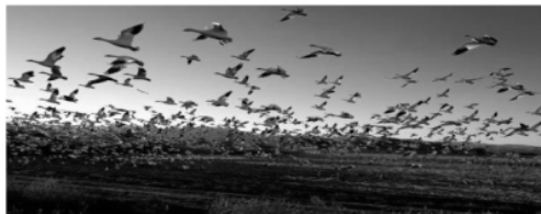
Gambar 1. Pola dari sekelompok burung saat mencari makanan. (Nedjah, 2006).

PSO merupakan koleksi, metode iterasi dengan menitikberatkan pada kerjasama. PSO berbentuk random parsial dan tanpa seleksi. Pendekatan PSO digunakan untuk menyelesaikan masalah optimasi. Pendekatan ini mempunyai banyak kelebihan antara lain sederhana, cepat dan dapat dikodekan dalam beberapa jalur ( lines ). Selain itu PSO mempunyai memori artinya setiap partikel mengingat (menyimpan) penyelesaian terbaik ( local ) dan juga penyelesaian terbaik global (Nedjah, 2006). Populasi awal pada PSO dipertahankan sehingga tidak diperlukan operator pada populasi. PSO didasarkan pada kerjasama konstruktif antara partikel (Al-Awami, 2007). Dalam hal ini, populasi setiap kandidat penyelesaian disebut dengan partikel. Partikel menempatkan posisinya berdasarkan pengalamannya dan pengalaman dari sekitar partikel tersebut. Jika partikel menemukan penyelesaian yang baru maka partikel-partikel yang lain akan bergerak mendekat, mengeksplorasi daerah tersebut lebih detail (Mukherjee, 2007).