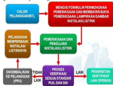
Gambar 3. SOP Penerbitan SLO.

Prosedur penerbitan sertifikat SLO digambarkan pada diagram blok dibawah ini :