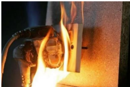
Gambar 2. Korsleting Listrik.