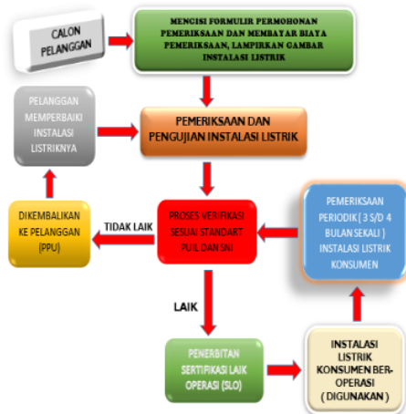
Gambar 4. Diagram Blok SOP Penerbitan SLO Yang Diusulkan.

Untuk dapat menghindari/mencegah sikap/kebiasaan konsumen yang tidak benar dalam penggunaan instalasi listrik, maka langkah yang harus ditempuh adalah melakukan pengecekan secara periodik terhadap rangkaian instalasi listrik konsumen yang dilakukan oleh PT. PLN sebagai penanggung-jawab manajemen tenaga listrik negara. Untuk mengimplementasikan langkah diatas adalah dengan solusi penambahan prosedur pada SOP penerbitan Sertifikat Laik Operasi (SLO). Dengan demikian perubahan SOP penerbitan SLO akan menjadi sebagai berikut :