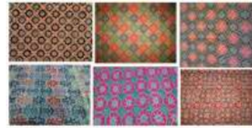
Gambar 7. Motif Jlamprang (Pekalongan)

Motif batik ini juga cukup terkenal di Pekalongan karena mudah digambar dan memiliki pola aksent geometris yang khas (titik, kotak, lingkaran, dan lainnya). Melalui pola ini, umat Hindu juga menggambarkan hubungan antara dunia dewa dan dunia manusia.