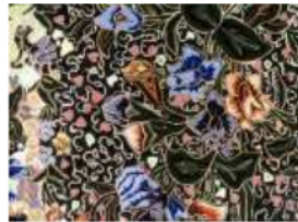
Gambar 5. Motif Tujuh Rupa (Pekalongan)

daerahnya dan melalui motif ini pula dapat kita lihat simbol akulturasi dari budaya Jawa dan Tiongkok yang dapat dilihat dari motif tumbuhan dalam motif tujuh rupa yang banyak diambil dari porselen Tiongkok (bunga lotus, bunga peony, dan lain-lain).