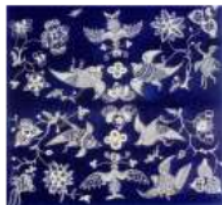
Gambar 3. 鸟纹 niǎo wén (Anshun)

Sama halnya dengan pola kupu-kupu, Anshun memiliki motif sendiri yang mengusung motif burung dalam batiknya. Motif burung di Anshun menggambarkan makna dari kebebasan dan kecintaan suku Miao terhadap alam, suku Miao juga memposisikan burung phoenix sebagai motif burung, sehingga tidak lagi hanya para bangsawan yang dapat menggunakan motif burung phoenix. Pola burung di Pekalongan hanya dijadikan pelengkap dalam motif yang lainnya, seperti pada motif tujuh rupa (burung merak, burung gereja), motif encim (burung hong), dan motif liong (burung phoenix).