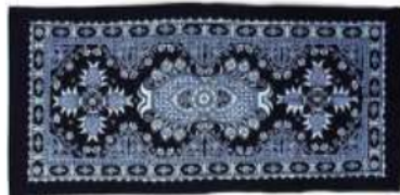
Gambar 11. 石榴纹 shíliú wén (Anshun)

Motif ini awalnya banyak ditemui sebagai dekorasi dalam agama Buddha, namun pada zaman Dinasti Tang, motif delima ini adalah sebagai simbol perdamaian dan cinta.