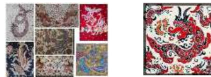
Gambar 1. Motif Liong (Pekalongan) dan 龙纹 lóng wén (Anshun)

Motif naga di kedua tempat memiliki makna yang sama yaitu kekuatan dan keberuntungan. Perbedaan antara motif naga di Pekalongan dan di Anshun yaitu terletak pada bentuk naganya, di Pekalongan mengusung bentuk naga yang realistis disertai dengan motif burung phoenix, sedangkan di Anshun mengusung bentuk naga yang menggemaskan, kekanakkan, dan memiliki bentuk yang sedikit aneh yang pada umumnya berbentuk “龙身鱼尾” lóng shēn yú wěi (badan naga ekor ikan), dengan motif seperti ini menjadikan karakteristik motif naga dari Anshun sangat unik dan khas.