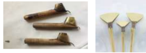
Gambar 4. Canting dan “蜡刀” là dāo

Alat bantu untuk membuat batik dengan cara ditulis ini di Pekalongan disebut canting dan di Anshun disebut “蜡刀” là dāo.