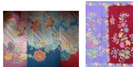
Gambar 8. Motif Encim (Pekalongan)

Melalui motif encim ini kita juga dapat melihat akulturasi budaya Tiongkok yang ada di Jawa, dengan dibuat oleh “encim” (sebutan untuk wanita yang sudah berkeluarga atau wanita usia paruh baya dari suku Tionghoa), motif ini mengandung tata warna famille rose , famille verte , dan sebagainya, dan juga mempunyai motif yang sangat khas dengan kebudayaan Tiongkok, seperti burung hong, naga, banji, kilin, dan lain-lain.