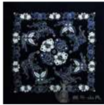
Gambar 2. 蝴蝶纹 húdié wén (Anshun)