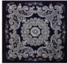
Gambar 9. 铜鼓纹 tóngǔ wén (Anshun)