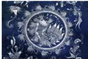
Gambar 10. 鱼纹 yú wén (Anshun)

Motif ini memiliki makna reproduksi karena ikan memiliki banyak anak, namun seiring dengan perkembangan zaman maka muncul juga makna lain seperti kebahagiaan, kerukunan, dan lain-lain yang mengekspresikan nilai keharmonisan di dalam keluarga. Suku Miao memiliki perumpamaan terhadap motif ini yaitu “子孙像鱼崽一样多” zǐsūn xiàng yú zǎi yīyàng duō (banyak keturunan seperti anak ikan).