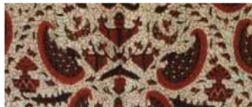
Gambar 6. Motif Sawat (Pekalongan)

Melalui motif ini para pembatik menunjukkan bahwa sebagian orang suku Jawa masih memiliki kepercayaan bahwa alam semesta dikendalikan oleh para dewa, sehingga melalui senjata pustaka Batara Indra yang diwujudkan ke dalam motif batik berupa sebelah sayap ini diharapkan agar pemakai selalu mendapatkan perlindungan dalam kehidupan.