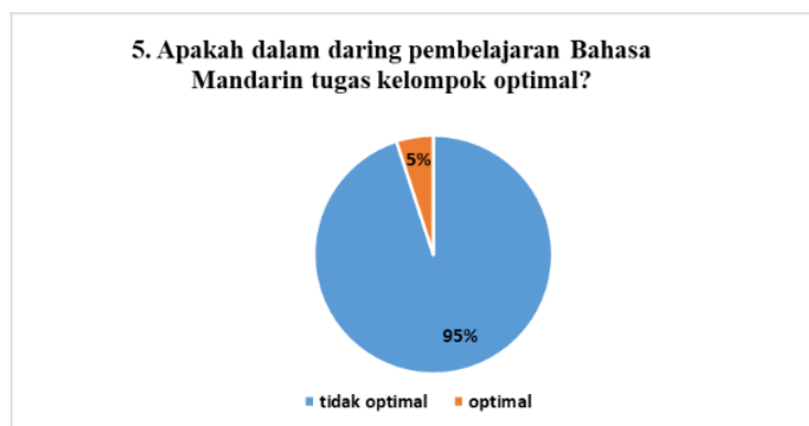
Gambar 8 Diagram Survei Keoptimalan Pengerjaan Tugas Kelompok

Hasil jawaban nomer 4 dari 20 siswa kelas 10 IPA dan 11 IPA mayoritas siswa bisa dalam mengerjakan soal-soal latihan dan PR yang diberikan oleh guru tersebut dan sebagian siswa mengeluhkan tidak bisa dikarenakan guru yang tidak jelas dalam menerangkan materi.