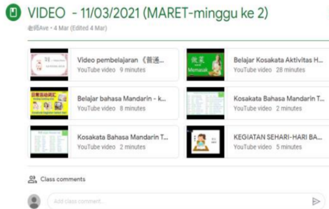
Gambar 3. PR Cerita Video