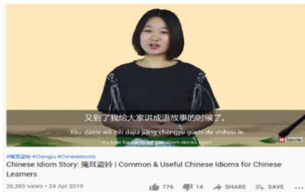
Gambar 4. Video untuk dipelajari