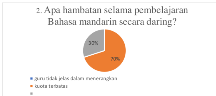
Gambar 6. Diagram Survei Hambatan Pembelajaran

Hasil jawaban nomer 1 dari 20 siswa kelas 10 IPA dan 11 IPA mayoritas siswa lebih menyukai pembelajaran tatap muka dikarenakan pembelajaran tatap muka memiliki komunikasi dua arah yang sangat baik sehingga menjadi penentu keberhasilan dalam pembelajaran sebagaimana pengertian pembelajaran tersebut yang berbunyi pelaksanaan pembelajaran merupakan proses membelajarkan peserta didik menggunakan asas pendidikan maupun teori belajar, merupakan penentu utama keberhasilan pendidikan. Pembelajaran merupakan komunikasi dua arah. Mengajar dilakukan oleh pihak guru sebagai pendidik, sedangkan belajar dilakukan oleh peserta didik. Sehingga bisa dilihat pada pembelajaran offline bisa terjalin lebih baik antara guru dan siswa.