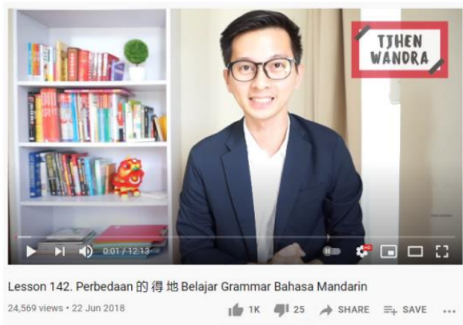
Gambar 2. Contoh materi video