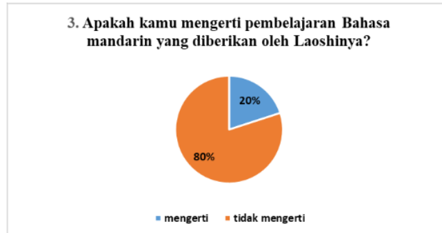
Gambar 6 Diagram Survei Pemahaman

Hasil jawaban nomer 2 dari 20 siswa kelas 10 Ipa dan 11 Ipa mayoritas siswa mengeluhkan guru yang tidak jelas dalam menerangkan dikarenakan dilakukan secara daring sehingga semua tergantung pada koneksi internet. Jika koneksi internet kita cepat maka video serta suara yang dihasilkan oleh aplikasi zoom tersebut akan lancar dan tidak tersendat-sendat serta ada beberapa siswa yang mengeluhkan terbatasnya kuota internet dikarenakan penggunaan aplikasi zoom ini menggunakan banyak sekali kuota internet akan sangat menyulitkan bagi mereka yang tidak berlangganan WI-FI.