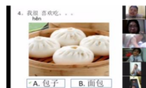
Gambar 7 Layar Monitor

menerapkan metode TPR, membuat peneliti sedikit kesulitan melihat siswa lain saat memperagakan tindakan motorik karena peneliti harus menggeser ke sisi berikutnya. Karena peneliti hanya menggunakan 1 perangkat komputer.