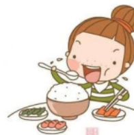
Gambar 1 Materi 1, 2, dan 3

Dengan penyamaan persepsi melalui gambar, kosakata ini dipraktikkan dengan cara tangan kanan digenggam seperti sedang memegang sendok dan mengayunkan tangan dari bawah seolah-olah ada piring kemudian mendekati tangan kemulut dan membuka mulut seperti memasukkan nasi ke dalam mulut diakhiri dengan menutup mulut dan mengunyah. Selain itu, dapat juga dipraktikkan dengan ujung kelima jari tangan kanan saling menempel dan diayunkan dari bawah ke atas kemudian didekatkan ke mulut. Kedua gerakan tersebut digunakan untuk mewakili dari kosakata makan.