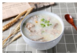
Gambar 5 Materi 7

Dengan penyamaan persepsi melalui gambar, kosakata ini dipraktikkan dengan menggabungkan kosakata 吃 (chī), menjadi bermakna makan bubur. Dengan cara tangan kanan menggenggam seperti sedang memegang sendok dan mengayunkan tangan dari bawah seolah-olah ada mangkuk kemudian mendekatkan tangan kemulut dan membuka mulut seperti memasukkan bubur