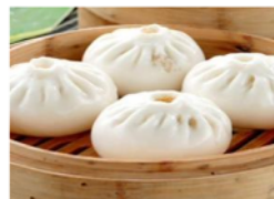
Gambar 4 Materi 6

Dengan penyamaan persepsi melalui gambar, kosakata ini dipraktikkan dengan menggabungkan kosakata 吃 (chī), menjadi bermakna makan bakpao. Dengan cara kedua tangan seperti memegang bakpao dan memakannya langsung, atau dengan merobek bakpao menjadi 2 buah bagian dan memakannya. Kedua gerakan tersebut digunakan untuk mewakili dari kosakata bakpao.