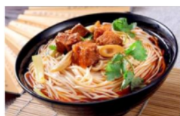
Gambar 3 Materi 5

Dengan penyamaan persepsi melalui gambar, kosakata ini dipraktikkan dengan menggabungkan kosakata 吃 (chī), menjadi bermakna makan mi. Dengan cara tangan kanan memunculkan jari telunjuk dan jari tengah seperti angka dua, kemudian seolah olah mencapit mi yang ada di mangkuk dan tangan didekatkan ke mulut. Selain itu,