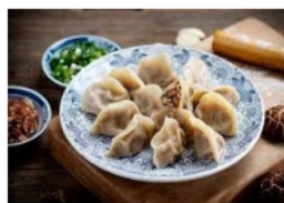
Gambar 6 Materi 8

Dengan penyamaan persepsi melalui gambar, kosakata ini dipraktikkan dengan menggabungkan kosakata 吃 (chī), menjadi bermakna makan pangsit. Dengan cara tangan kanan memunculkan jari telunjuk dan jari tengah seperti angka dua, kemudian seolah-olah mencapit suatu barang seperti penghapus yang diandaikan adalah pangsit dan tangan didekatkan ke mulut. Selain itu, dengan menggunakan 2 buah pensil yang digunakan sebagai pengganti sumpit dan mencapit penghapus. Dapat pula dengan menusuk ujung pensil ke penghapus. Ketiga gerakan tersebut digunakan untuk mewakili dari kosakata pangsit.