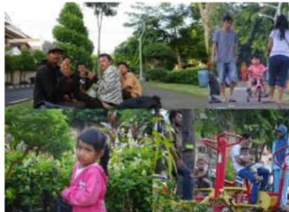
Gambar 2. Aktivitas Pengunjung Taman Nginden Intan Sebelum Pandemi

Sebelum pandemi covid-19 melanda, mayoritas pengunjung yang datang kesana berasal dari kalangan anak – anak, remaja, orang dewasa dan juga manula. Biasanya anak – anak bermain dengan orang tuanya di area bermain, berjalan-jalan dan menikmati lingkungan sekitar. Sedangkan aktivitas para remaja lebih kepada berkumpul bersama teman-teman, bersantai, dan berolahraga. Berbeda dengan orang dewasa dan manula, mereka biasanya berkumpul untuk bertemu rekan-rekan, menikmati suasana taman, berolahraga dan terapi kesehatan di taman refleksi. Aktivitas pengunjung banyak dilakukan pada jalur pedestrian dan area taman bermain. Saat ini, Kondisi Taman Nginden Intan sering ditutup sementara untuk membendung kasus lonjakan covid-19 . Namun hal tersebut tidak menutup niat masyarakat untuk tetap datang kesana. Masyarakat masih melakukan aktivitas olah raga di luar taman, yang memakan area jalan raya utama.